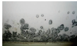
Vägg med mögel

Vill du veta mer om svampar och fukt så kontakta oss. Vi har kunskapen och kompetensen.